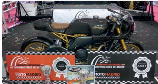
Ganador absoluto 2017: Kacerwagen - Pili